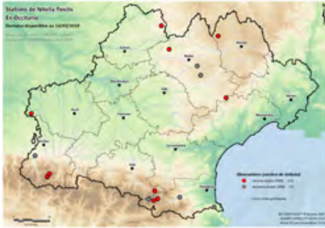
Figure 3 État actuel de la connaissance de Nitella flexilis en Occitanie.

présence actuelle est très diffuse dans les départements de la région (Fig.3). Elle colonise les eaux stagnantes à faiblement courantes (marges de petits cours d'eaux), un peu acides s'échauffant peu l'été.