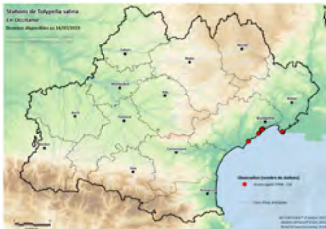
Figure 4 État actuel de la connaissance de Tolypella salina en Occitanie.

Elle est rare du fait de ses exigences écologiques assez strictes (lagunes saumâtres, avec assècs estivaux sur substrats sablo-limoneux).