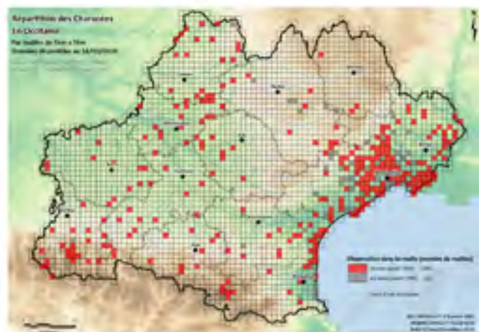
Figure 2 État des connaissances actuelles des Characées en Occitanie en 2018.