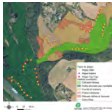
Figure 2 : Localisation des 112 pièges disposés dans les cinq habitats ciblés pour l'inventaire sur la RNR Confluence Garonne-Ariège

Ces pourcentages fluctuent également sur la chênaie-frênaie avec successivement 35%, 19% puis 17% des captures, et sur les pelouses sèches et tonsures avec successivement 9%, 7% puis 19% des captures. Ces valeurs ont été en revanche stables sur la friche herbacée, avec 28%, 26% puis 23% des captures.