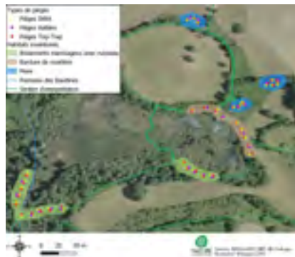
Figure 1 : Localisation des 100 pièges disposés dans les trois habitats ciblés pour l'inventaire sur la RNR Marais de Bonnefont

de la RNR Confluence Garonne-Ariège, ces pourcentages sont plus variables suivant la période, avec 48% des captures en forêt alluviale en juillet pour 28% puis 36% aux mois de septembre.