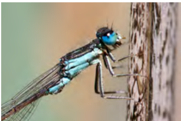
Photo B : Leste à grands stigmas ( Lestes macrostigma )

Le Leste à grands stigmas, Lestes macrostigma , est une espèce méditerranéo-touranienne inféodée aux marais saumâtres littoraux (Boudot & Kalkman, 2015). Historiquement citée de la région, des populations ont été (re)découvertes très récemment (2017) dans l'Hérault et le Gard. Probablement issues de la dispersion provenant des populations camarguaises aux effectifs très fluctuants (Lambret et al. , 2017), les deux stations n'avaient pas encore pu être confirmées lors de l'évaluation pour la Liste rouge. En l'absence de preuves de pérennité pour ces populations régionales nouvellement découvertes, le Leste à grands stigmas n'a pas été évalué et placé dans la catégorie « Non applicable » (NA). Malgré tout, cette espèce est inféodée à un habitat particulièrement vulnérable à l'artificialisation et démoustication du littoral et au changement climatique. L'espèce, confirmée en 2018, présente un très fort enjeu de