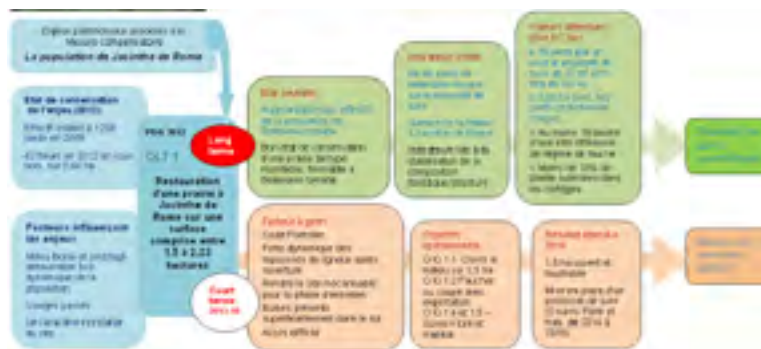
Figure 1 – Problématique et attendus du PDG du site en compensation

Un plan de gestion a été rédigé sur 13 ha du DPAC (ENJALBAL M. et al. 2012). Nous présentons la gestion réalisée de 2013 à 2018 en suivant le schéma ci-après, dont l'organisation est inspirée d'un travail collectif (Collectif 2017).