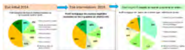
Figure 4 - Comparaison des profils de végétation entre la prairie et l'Etat objectif

Une liste référence de 35 plantes indicatrices de régime de fauche sur sols frais à inondables et des diagrammes relatifs au profil floristique de cet état (Fig. 4) ont été produits.